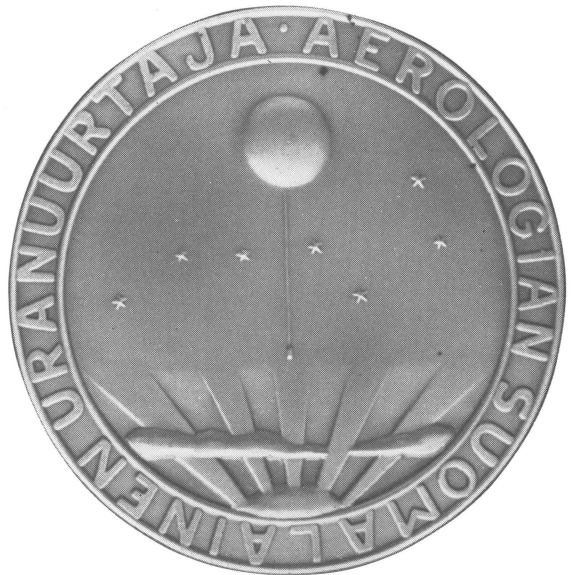
バイサラ記念メダル（裏面）