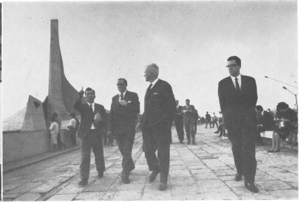
写真6 都内観光 (10月17日)