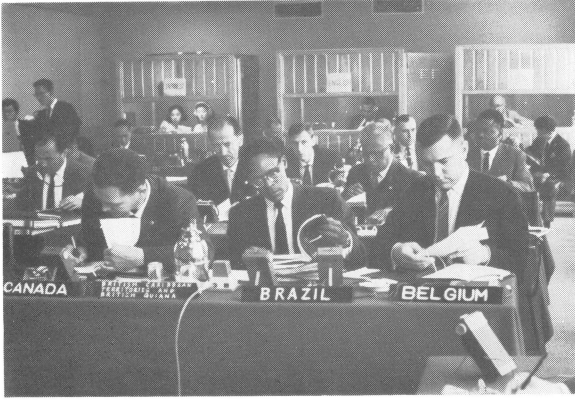
写真1 同時通訳者の設備 (B委員会場、後方に3つの部屋が見える。)