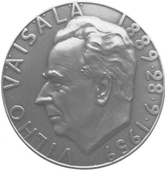
気象庁長官に贈呈されたバイサラ 記念メダル（表面）