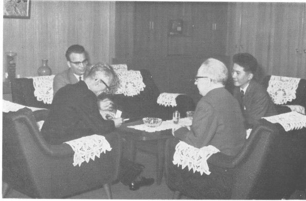
気象庁長官を訪問したフィンランドの代表 バイサラ教授（右から2人目）とトイボラ氏（左端）