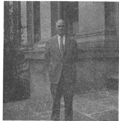
写真 3 G.B. Schubauer