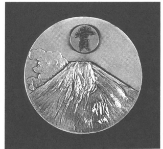
山本・正野論文賞