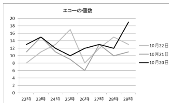
図2 観測されたエコーの一時間ごとの合計数の推移

10/20～10/22の22:00～翌6:00に記録された画像ファイルを確認し、流星のエコーの一時間毎の総数をまとめると図2のようになった。10/22の明け方がオリオン座流星群のピークと予想されていたのに対し、今回の観測では10/21の明け方が流星群のピークであるという結果になった。