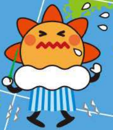
洪水警報の危険度分布