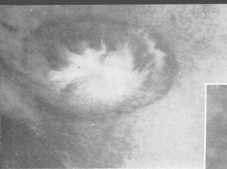
15 時 15 分