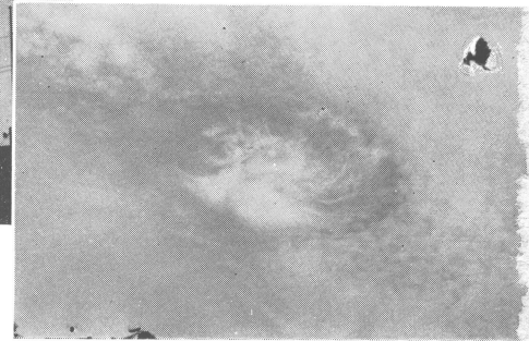
15 時 30 分