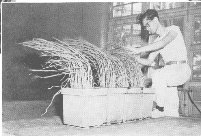
出穂期の稲に風を当てる