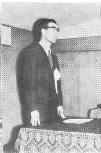
日本学術会議会長 茅 誠司博士