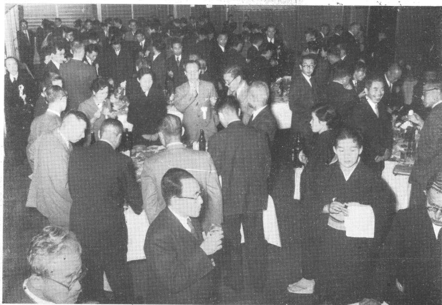
祝 賀 会 の 光 景