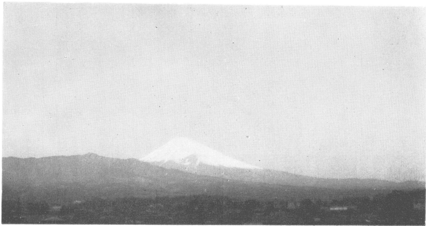
13h15m 下層雲なし (三島測候所より富士山方向(N)を写す)