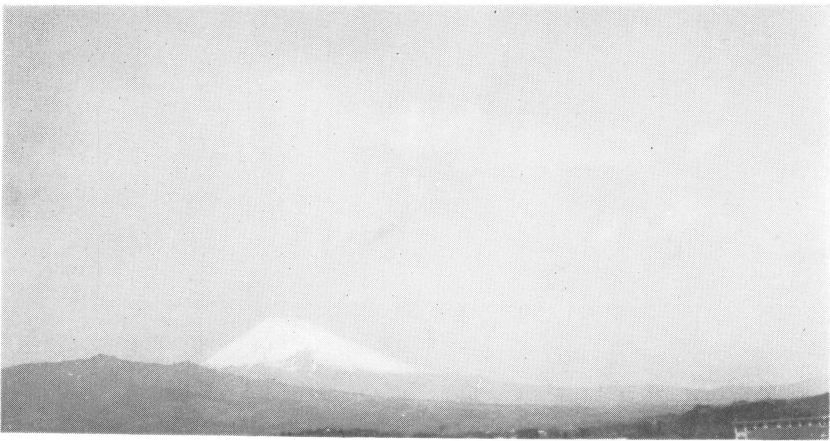
13h00m 0+Fc × 20 Fc 12h48m 発生. 13h10m 消滅す.