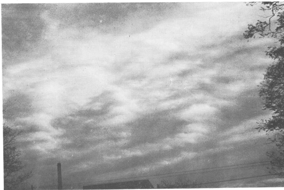
層状の層積雲：1956年の雲図帳によれば Stratocumulus stratiformis opacus すなわち層積雲—層状—不透明と分類される。