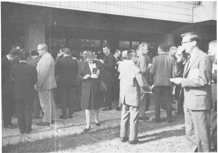
札幌セミナー会場風景