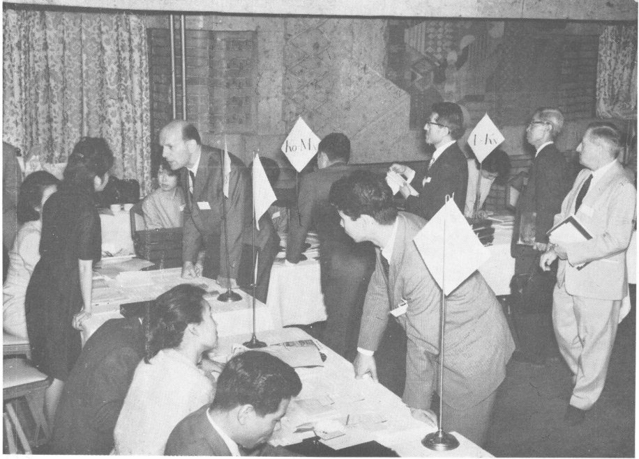
東京会場受付風景