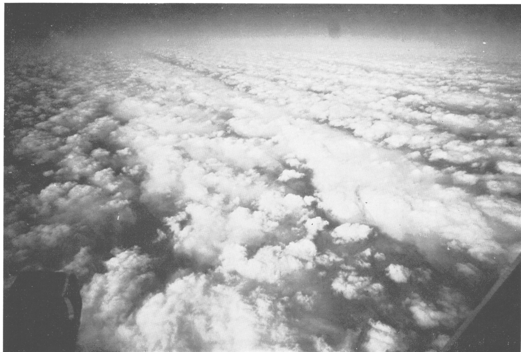
第4図 b. 12時54分