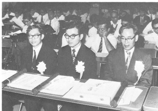
学会賞・藤原賞受賞者