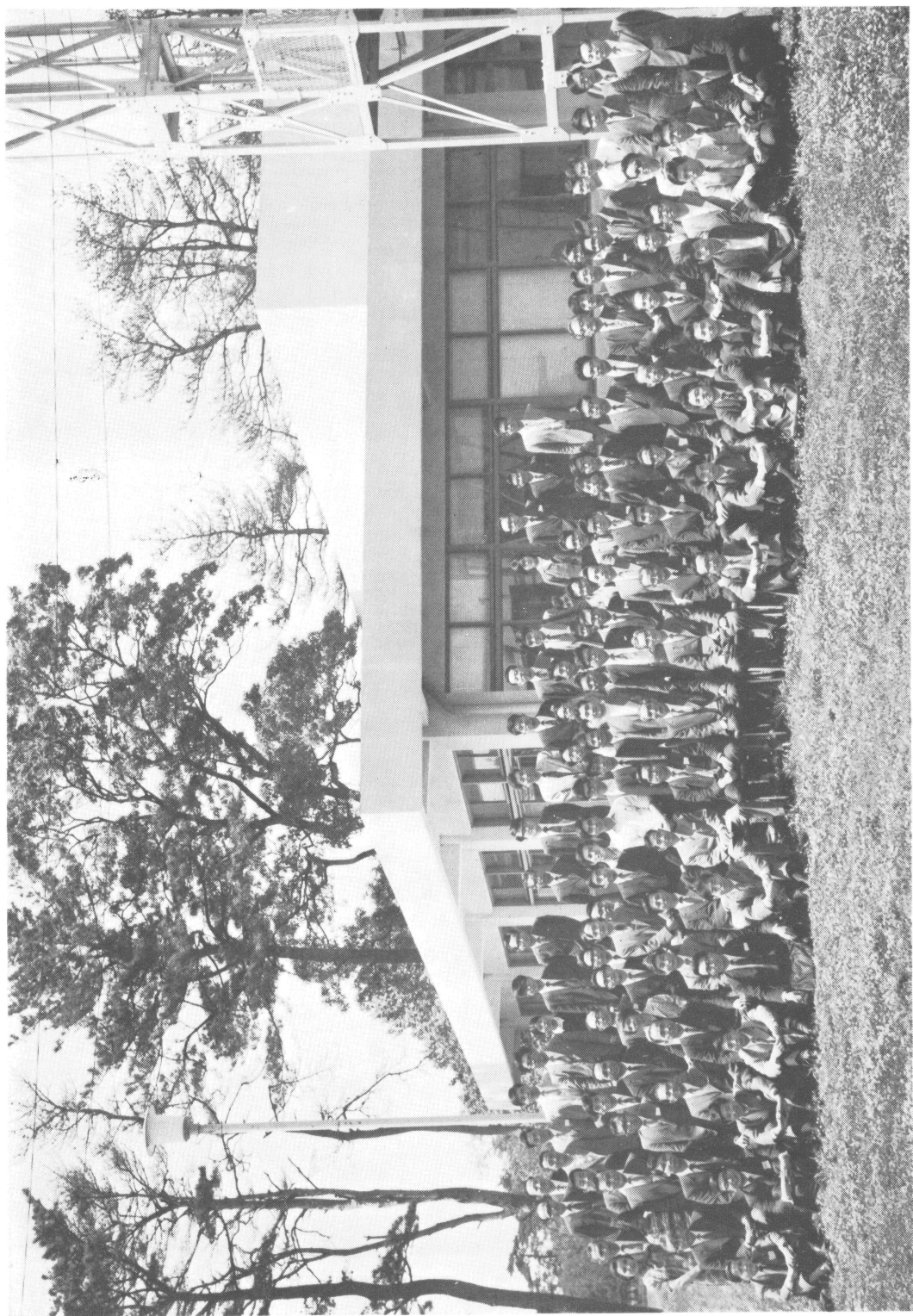
昭和47年度 日本気象学会春季大会 (千葉県柏市・気象大学校)