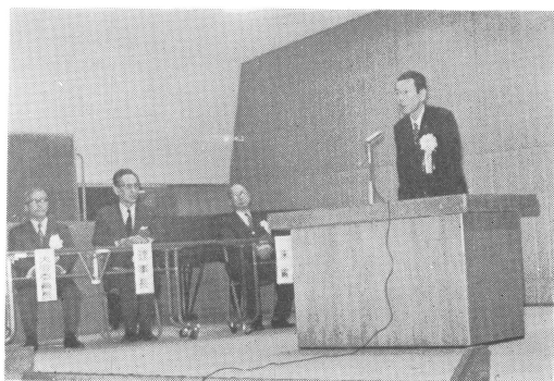
新潟県知事（代理）祝辞