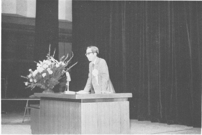
岸保理事長あいさつ