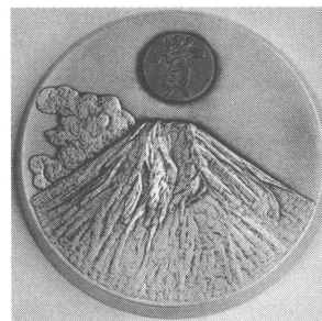
山本・正野論文賞

大きさ：直径 110 mm, 材質：銅 (銀いぶし, 賞：金 咲平：銀) 裏：藤原賞 贈 氏名 君 日本気象学会 西暦 年