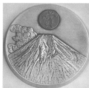
山本・正野論文賞

大きさ：直径 110 mm, 材質：銅 (銀いぶし, 賞：金 咲平：銀) 裏：藤原賞 贈氏名君 日本気象学会 西暦 年