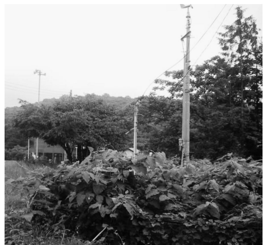
第1図 岩手県の藪川アメダス（2006年7月11日）。

その2006年、藪川アメダスは気温観測用の通風筒は見えたが、雨量計は密に茂った雑草に覆われほとんど見えなかった。この頃から、私は日本の観測所の実態