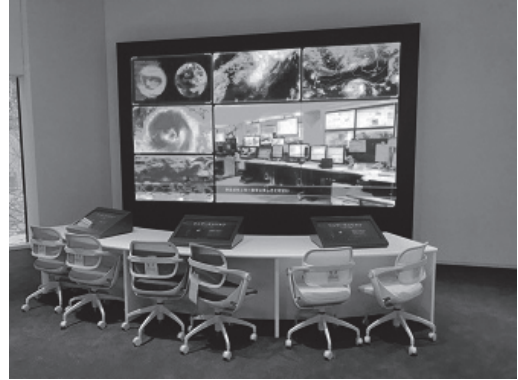
ウェザーミッション ～キミは新人予報官～

※上記の番号でみなと科学館の電話受付につながりますので、こちらで「気象科学館への入館希望」とお伝えください。