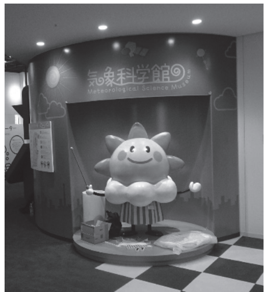
館長のはれるんとともに、ご来場をお待ちしています！