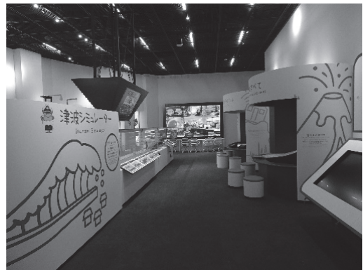
津波シミュレーター