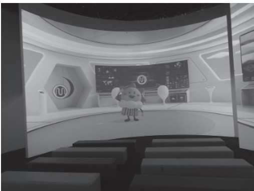
うずまきシアター